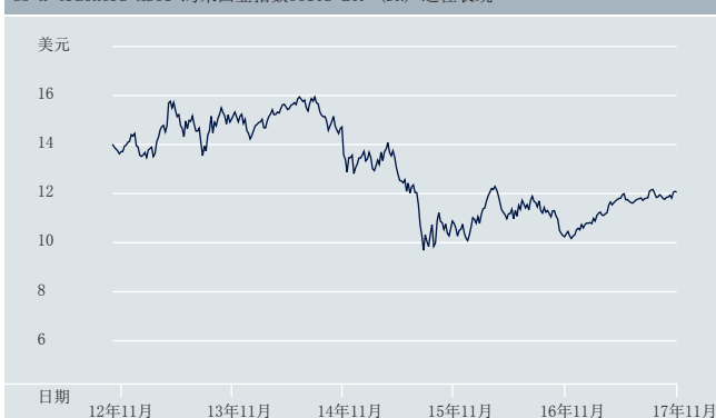
db x-trackers MSCI 馬來西亞指數UCITS ETF (DR) 過往表現

資料來源：德意志銀行2017年11月30日 過往表現不保證未來的回報。基金表現是按資產淨值作為比較基礎，以美元為計算單位，股息再投資(如有)。指數為總回報指數。