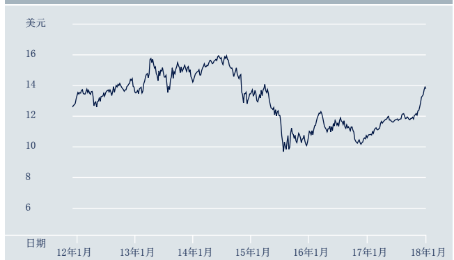
db x-trackers MSCI 馬來西亞指數UCITS ETF (DR) 過往表現