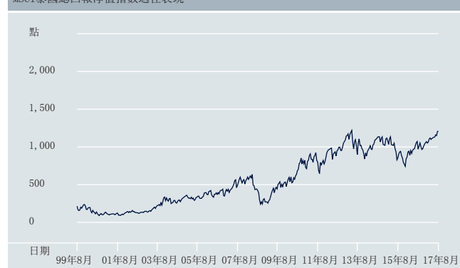
MSCI泰國總回報淨值指數過往表現

資料來源：彭博資訊2017年8月31日 過往表現不保證未來的回報。基金表現是按資產淨值作為比較基礎，以美元為計算單位，股息再投資(如有)。指數為總回報指數。