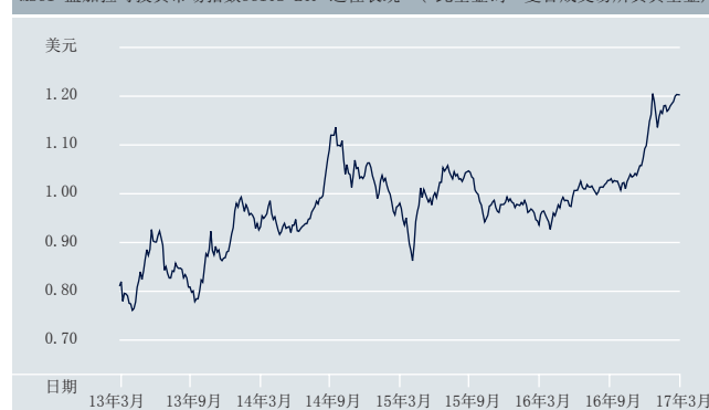
MSCI 孟加拉可投資市場指數UCITS ETF 過往表現* (*此基金為一隻合成交易所買賣基金)

過往表現不保證未來的回報。基金表現是按資產淨值作為比較基礎，以美元為計算單位，股息再投資(如有)。指數為總回報指數。